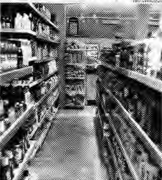
Em abril houve queda nos preços da cesta básica (-7,51%), da cesta de alimentos (-5,16%), da cesta de roupas (-7,71%) e da cesta de outros bens (-6,04%)

A inflação sobre o consumo de produtos e serviços comercializados em lojas varejantes em consumo pessoal das famílias, medida pelo Índice Nacional de Preços ao Consumidor Amplo (INPC) do IBGE, em maio de 2023 recuou 0,57% em relação a abril de 2023. O índice de maio de 2023 recuou 0,57% em relação a abril de 2023 e 0,44% em relação a maio de 2022.