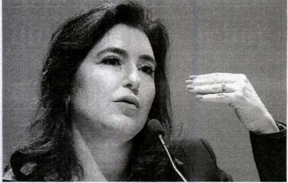
"É um bloqueio temporário, isso é contábil. Você bloqueia, com o incremento da receita, no próximo relatório você poderá desbloquear"

bilhões de repasses para estados e municípios a partir da sanção da Lei Paulo Gustavo, que destinou recursos para o setor cultural, além da complementação do piso nacional da enfermagem. Esses bloqueios poderão ser revertidos mais adiante com mudanças nas estimativas de receitas e despesas. Esses números reverteram a folga de R$ 13,6 bilhões no teto de gastos que havia sido apresentada no relatório anterior. A regra do teto deverá ser substituída por uma nova regra fiscal, que vai à votação nesta semana na Câmara dos Deputados. O teto estouraria neste ano, mas a PEC da Transição, promulgada no fim do ano passado, retirou do limite de gastos R$ 145 bilhões do Bolsa Família e até R$ 23 bilhões em investimentos, caso haja excesso de arrecadação. O governo também elevou a estimativa de déficit primário de R$ 107,6 bilhões para R$ 136,2 bilhões, equivalente a 1,3% do Produto Interno Bruto (PIB, soma dos bens e serviços produzidos no país), segundo a edição Relatório de Avaliação de Receitas e Des-