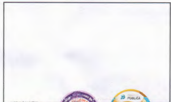
JOAQUIM GABRIEL BEZERRA FRUTUOSO VEREADOR

Coloco-me à disposição para prestar informações adicionais, se necessário.